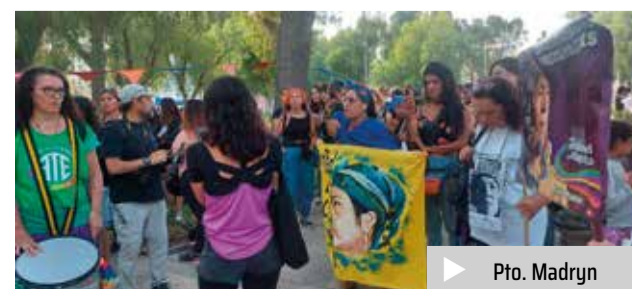
▶ Pto. Madryn