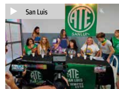
▶ San Luis