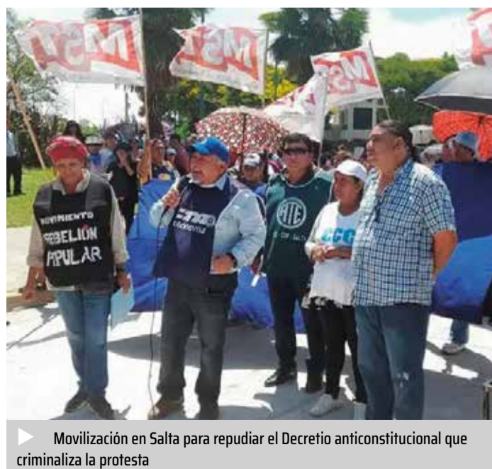
Movilización en Salta para repudiar el Decreto anticonstitucional que criminaliza la protesta