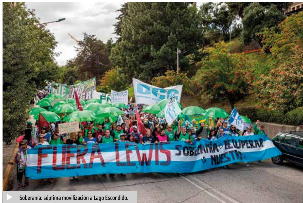
▶ Soberanía: séptima movilización a Lago Escondido.

Los organizadores de la movilización también informaron que promoverán una movilización hacia Sierra Grande, Río Negro, donde Lewis tiene un establecimiento con una pista aérea con salida al Atlántico que, junto a la cercanía de la frontera con Chile en Lago Escondido, otorga una posición estratégica que podría intentar contra la defensa nacional.