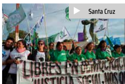
▶ Santa Cruz