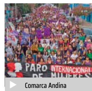
▶ Comarca Andina