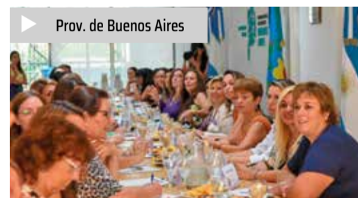
▶ Prov. de Buenos Aires