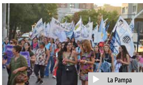
▶ La Pampa